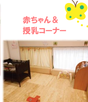
赤ちゃん & 授乳コーナー