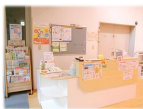
受付 & 子育て情報コーナー

おやこ DE 広場・根木内こども館は、日の光がさしこみ明るく開放的な空間となっています♪ 小さなお子さんがハイハイやつかまり立ちを自由にできたり、親子でゆっくり絵本を見ることが出来ます。また、みんなで線路をつないで電車を走らせたり、大型すべり台の上り下りを繰り返すなど、親子やお友だちとのふれあい時間を楽しめる場所です。