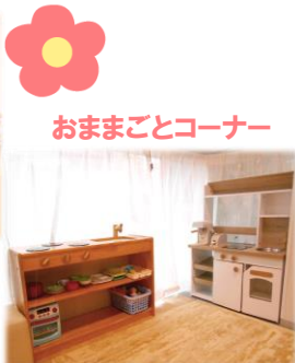
おままごとコーナー