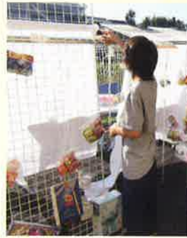
千本釣り 大当たり!?

釣り、スライム、クイズ、昔遊び、千本釣り、的当て、ビンゴの遊びコーナーや食事のキッチンカーコーナーがあり、今回は初めての試みとして遊びコーナーは子どもが主として運営をしました。事前はどうしたらみんなが楽しめる縁日にできるかと何度も打ち合わせを重ね、当日は9時から準備を進めました。