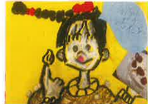
私は誰でしょう? 絵:Cちゃん(小4)