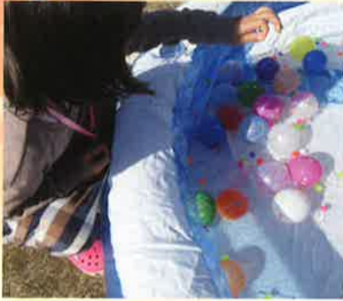
ヨーヨー釣り そーっと、そーっと

11月3日(祝)おうち縁日を開催しました。コロナウィルスの影響でお祭りのようなことが出来ない日が続いているため、園内で何か楽しめることをしたいと今回のおうち縁日の開催となりました。