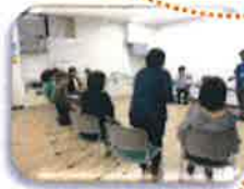
8人の仲間に、 自己紹介・ 2期生研修風景

日本では2016年、福岡市が初めて導入、その後大分、三重、山梨、仙台市、静岡市、東京等で続々と開催、高い評価を受けています。千葉でも一昨年、昨年と実施してきました。