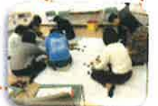
ロールプレーは 楽しそうですね。

1回3時間12週連続と聞くと驚くかもしれませんが、回を追うごとに内容が深まっていきます。12回の中で、きっと自分に合ったツールを見つけることができるでしょう。何より、かけがえのない仲間との出会いがあります。