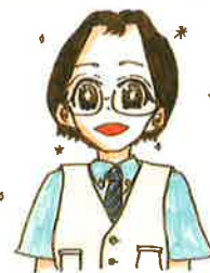
施設長の似顔絵 画伯:1ちゃん(小5)

能性の向上、子ども主体 に作成されたホーム職員 と多専門職の様々な視点 による自立支援計画の構 築を進めています。