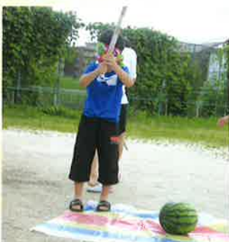
スイカはここだ!!エイっ!!

引き続き皆様方のご理解ご協力をお願い申し上げますと共にまだ先の見えない新型コロナ禍の中、皆様のご健勝を心から祈念申し上げます。