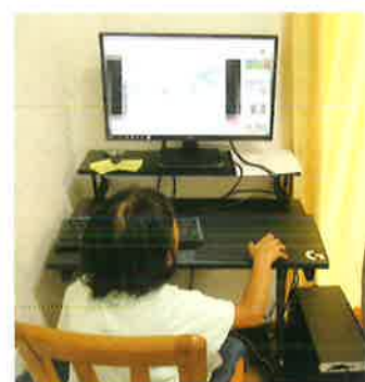
できることふえたよ~!