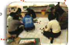
ロールプレーは楽しそうですね。

1回3時間12週連続と聞くと驚くかもしれませんが、回を追うごとに内容が深まっていきます。12回の中で、きっと自分に合ったツールを見つけることができるでしょう。何より、かけがえのない仲間との出会いがあります。